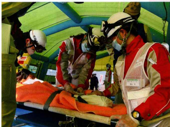
感染症流行下においても災害救護活動を実施します。

日本赤十字社は、苦しんでいる人を救いたいという思いを結集し、人のいのちと健康、尊厳を守ることを使命として、世界192か国に組織された赤十字・赤新月社と連携し、国内外において様々な人道的活動を展開しています。