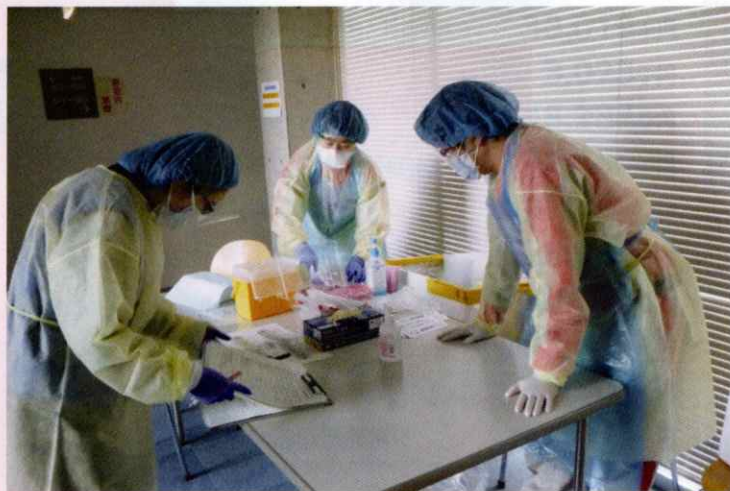
新型コロナウイルス等の感染症流行時にも医療救護班を派遣します。