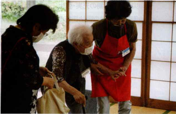
赤十字奉仕団が地域における高齢者の支援などの様々なボランティア活動を行います。