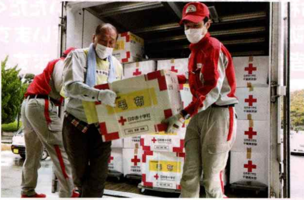
大規模災害や火災・水害等により被災された方に迅速に救援物資をお届けします。