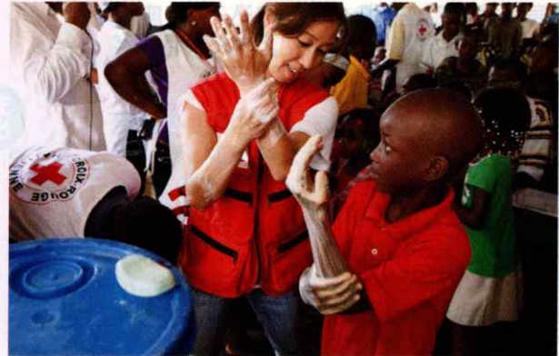
海外の紛争や災害で苦しむ人々を支援します。