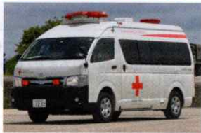
災害救援車両 1,100万円