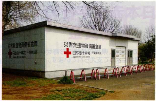
災害時に必要な施設や資機材を整備します。