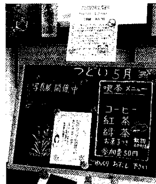
喫茶室「つどい」の風景

こてはし台地区部会では、「住んでいて良かった」と思われる魅力的な街づくりを目指し、福祉活動の拡充に努めています。主な事業として、ふれあい食事会、喫茶室「つどい」（ふれあいいきいきサロン）などのふれあい3事業、「ご近所のたすけあい」、「お元気確認（見守り・声かけ）」、安心カード・緊急ダイヤルメモの配布、三世代ふれあいラジオ体操、敬老祝賀会、餅つき大会等の事業を実施しています。