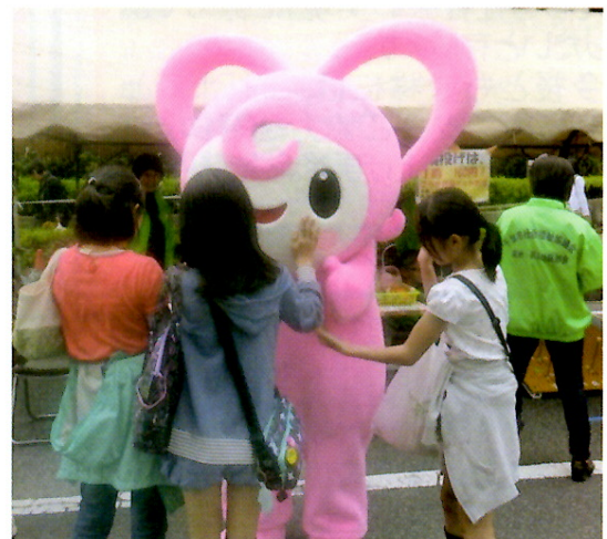
「第32回5・5まつり」にて(美浜区高洲)