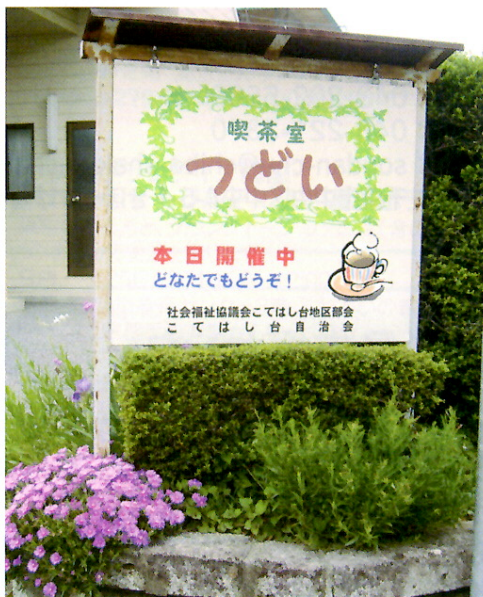
喫茶室「つどい」(こてはし台地区部会)