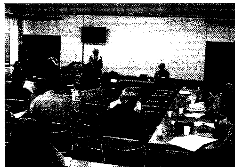
協力員対象の「災害時安否確認」の説明会

※高齢者世帯とは、65歳以上の方のみで構成されるか、または65歳以上の方と18歳未満の未婚の方が加わった世帯のこと。