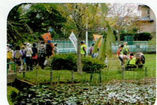
刈田子公園でひと休み