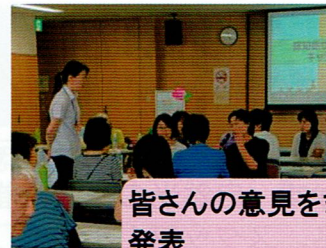
皆さんの意見をまとめて発表