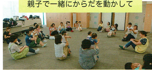
親子で一緒にからだを動かして