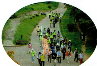
今回は全員たつぷりコースを歩きます

9月26日(木)第2回ふれあい散歩がおゆみ野公民館より、参加者25名スタッフ22名が出発しました。今回はおゆみ野駅の近くの椎名神社から聖宝寺、常福寺、刈田子公園、白幡神社を巡りました。