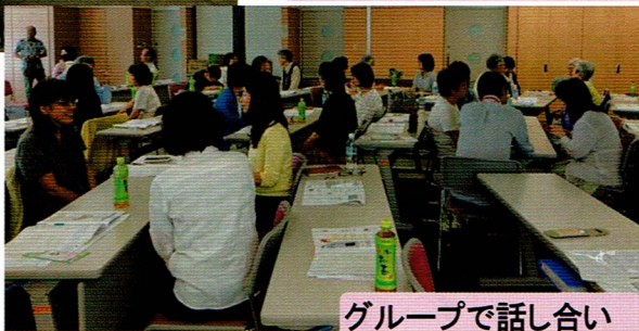
グループで話し合い