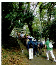
階段だって足どり軽く

9月26日(木)第2回ふれあい散歩がおゆみ野公民館より、参加者25名スタッフ22名が出発しました。今回はおゆみ野駅の近くの椎名神社から聖宝寺、常福寺、刈田子公園、白幡神社を巡りました。