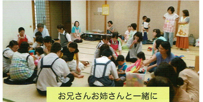
お兄さんお姉さんと一緒に

9月17日（火）鎌取コミュニティセンターにて、千葉聾学校の生徒さんも参加して開催されました。親子27名、スタッフ17名でした。