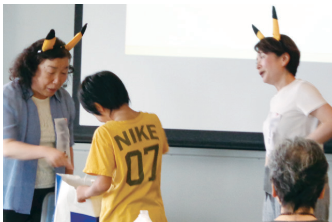
▲言われていることがわからない...どうしよう