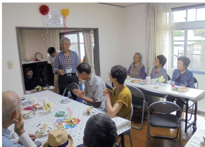
▲交流の場で楽しいひととき