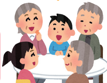
交流の場「ふれあい虹の家」

地域の居場所として、イベントでの利用や近隣の方々への利用貸出しなど、さらなる活用をしていきたいです。