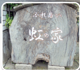
◀メンバー手作りの木彫り看板