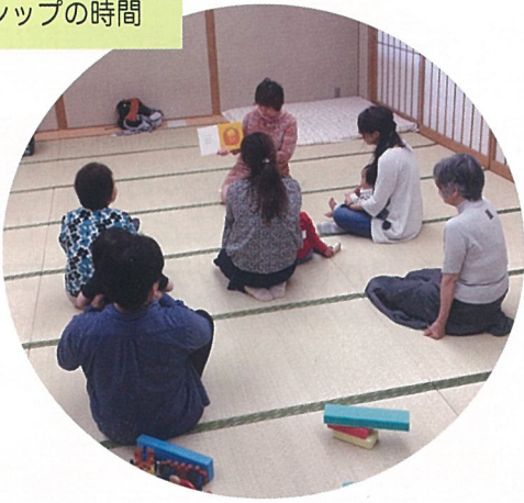
絵本の読み聞かせも 大事なスキンシップの時間