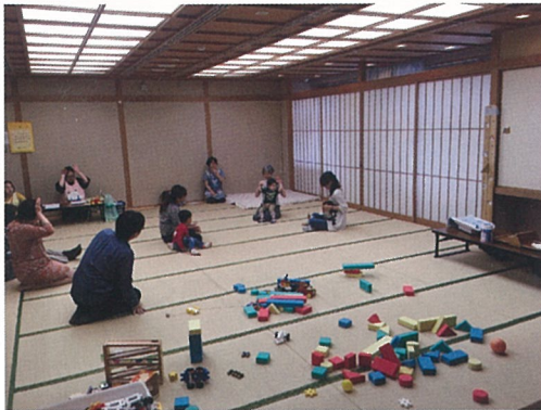
抱っこして、手遊び

おもちゃを広げて置いておくと、子どもたちは、大人が思いもつかない遊び方をします。あまり手を出さず、でも怪我などしないように、少し離れたところで見守ることも大事なことです。