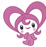
読み聞かせボランティアのみなさん