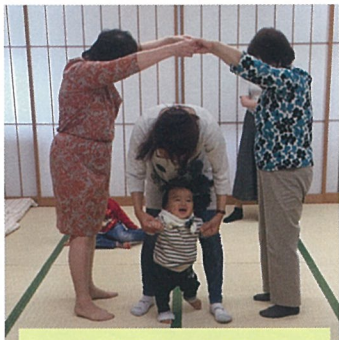
つかまらないように！