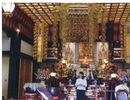
鎌取コミュニティセンターから45分ほど歩いて到着です