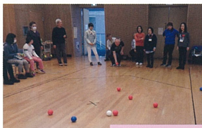
投げるのも審判も真剣に