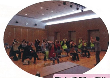
歌と手話で脳トレ