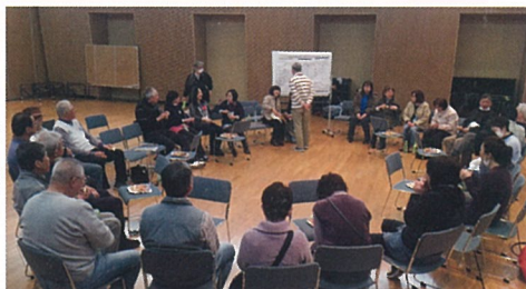
みんなの顔が見えるように、輪になって