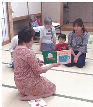
今日の絵本は、どんなお話？