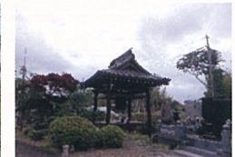
江戸時代の建造といわれる山門と鐘楼堂

金楽山金城寺の名称の由来は、お寺の裏山の土壌が砂鉄を含み、遠くから見るとキラキラと光り見えるところが数か所あったことからだそうです。