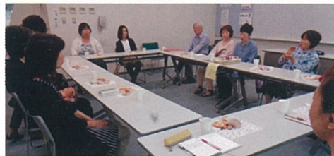
お茶をいただきながら、和やかな雰囲気