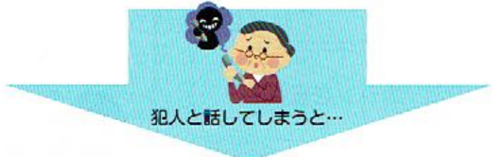
犯人と話してしまうと…