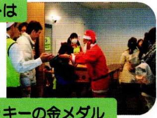
クッキーの金メダル