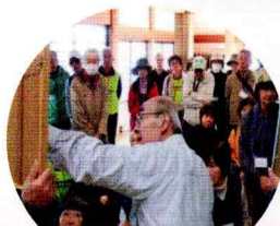
ご住職様の説明を聞きます

途中、真言宗豊山派南光山廣照寺に立寄り、本堂の天井絵を見学しご住職様より昔の様子をお聞きました。