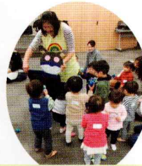
ばいきんまんに当てながら、玉集め。