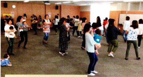
準備運動を兼ねて