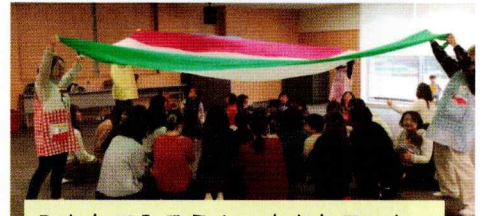
みんなで入ろう！ 大きなテント。