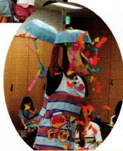
くす玉割り割れるかな？割れた！