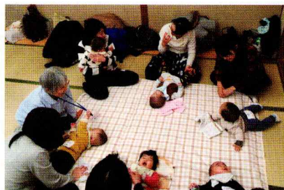
月齢が近いので、おしゃべりも弾みます。