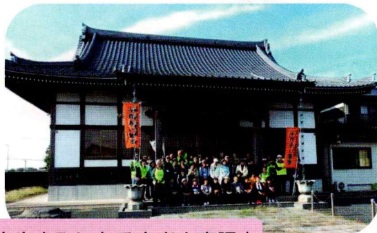
南生実町にある南光山廣照寺