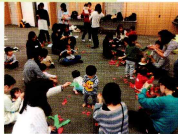
クリスマスカラーの色紙をちぎって