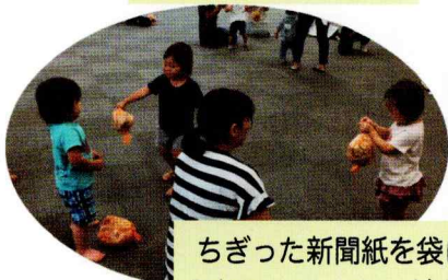
ちぎった新聞紙を袋に入れて、ヨーヨーだよ。

12月12日、緑保健福祉センターにて開催されました。参加親子52名、スタッフ7名、合計57名でした。