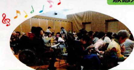
全員でクリスマスソングの合唱♪