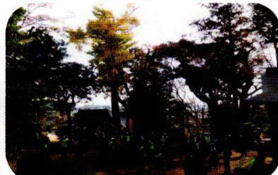
境内のイチョウも美しい八剱神社