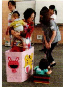
障害物競走・かな？