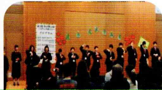
泉谷中の皆さんの合唱は手話をしながら