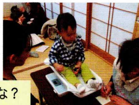
大きくなったかな？

サロンでは、身長・体重も測定できます。緑保健福祉センターの保健師さんとも連携していますので、心配事があれば、スタッフに声をかけてくださいね。