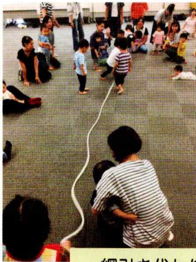
綱引き代わりにロープで遊ぼう！