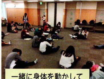
一緒に身体を動かして

親がとびきりの笑顔を見せると、子どもも素敵な笑顔で返してくれます。表情って、とても大切ですね。