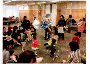
今度は、玉入れたよ。