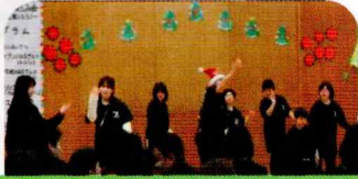
スリーセブンの軽快なダンス

12月8日(土)、鎌取コミュニティセンターで第13回冬のお楽しみ会『ジャグリングを楽しもう』が開催されました。参加者107名、スタッフ22名、合計129名が冬のひとときを楽しみました。