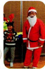
サンタさんと トナカイさん