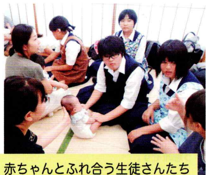
赤ちゃんとおふれあう生徒さんたち

やってみせ、言ってきかせて、させてみせ、ほめてやらねば人は動かじ。話し合い、耳を傾け、承認し、任せてやらねば、人は育たず。やっている姿を見守って、信頼せねば、人は実らず。