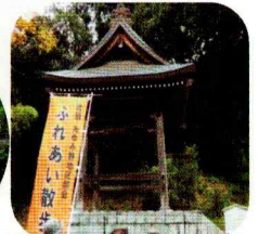
千手観音堂山門と鐘つき堂