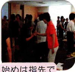
始めは指先で ごあいさつ