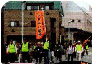
南に向かって、おしゃべりしながら歩きます

9月27日(木)雨が心配される中、参加者19名スタッフ21名が鎌取コミュニティセンターより千手観音堂に向けて出発しました。イオンタウンおゆみ野の隣にある『どうのうしろ公園』裏の山道を登ると、そこは別世界のような空間が広がっていました。