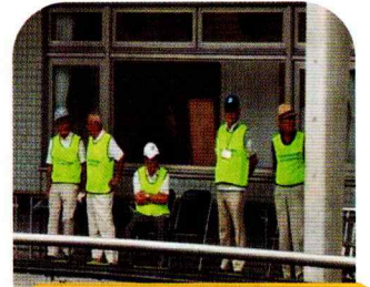
ボランティア委員会の皆さんがスタンバイ