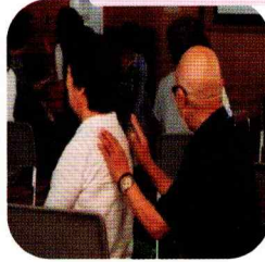
優しく、ゆっくり、タッチ