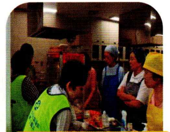
ポップコーンの準備中