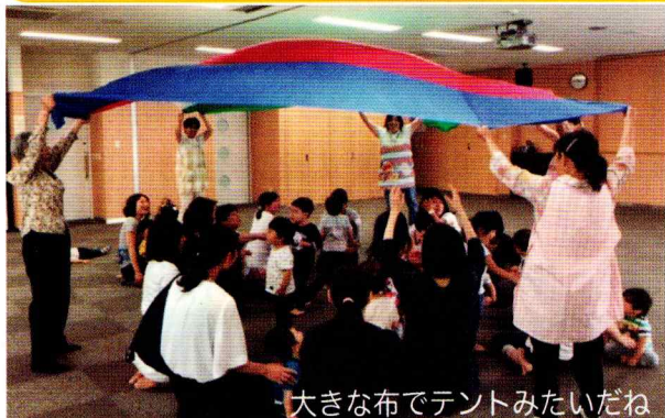
大きな布でテントみたいだね

6月6日、緑保健福祉センターにて開催されました。親子32名、スタッフ7名合計39名の参加しました。