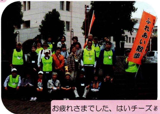
お疲れさまでした、はいチーズ