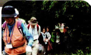
緑のトンネルを抜けたら、到着！