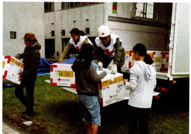
災害時に救援物資を迅速にお届けします。