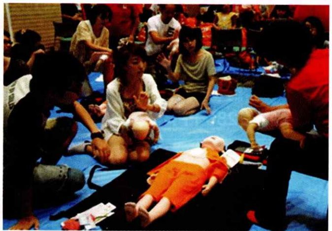
いのちを救う方法や、健康で安全に暮らす知識と技術を普及しています。