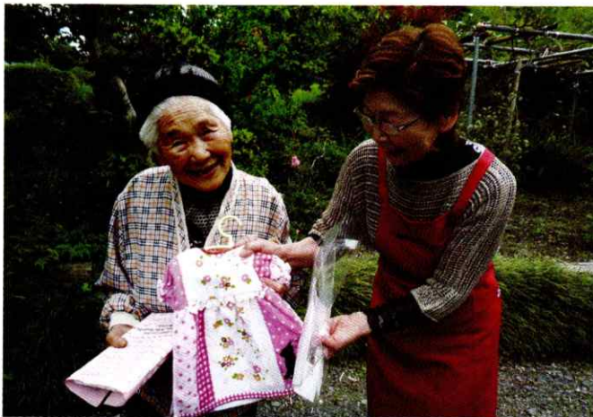
赤十字奉仕団が地域において高齢者の支援などの様々なボランティア活動を行っています。