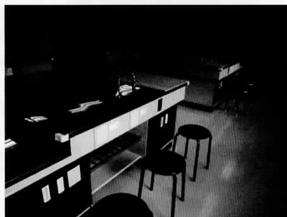
撤去される調理台