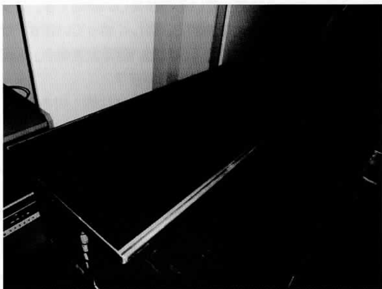
新たに設置する、キャスター付きの中古の机

今後、机の追加は、他のサークル室と同じ折りたたみ式の机とパイプ椅子の追加を検討していますが、ご意見等があれば、運営委員にご連絡ください。