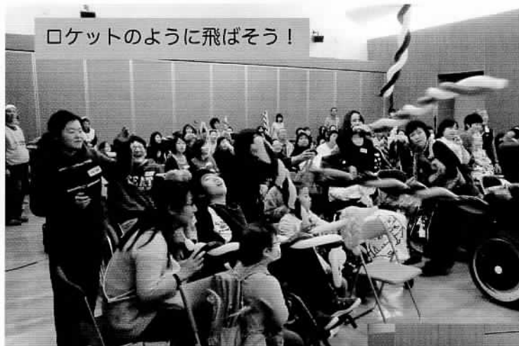
ロケットのように飛ばそう！

12月9日(土)、鎌取コミュニティセンターにて、『お楽しみクリスマス会』が開催されました。