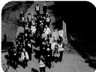
秋の日差しの中、気分は爽快、足取りも軽く進みます。