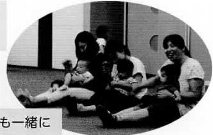
小田先生も一緒に

11月16日(木)、おゆみ野公民館で開催されました。親子14組29名とスタッフ10名とボランティア4名でした。