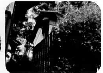
高梨家の立派な蔵とステキな庭