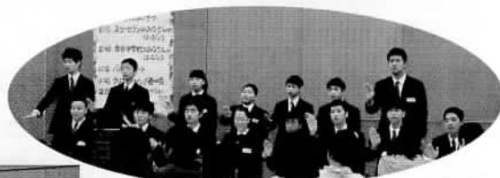
泉谷中特別支援学級のみなさんによる『手紙』手話をしながらの合唱

泉谷中特別支援学級の生徒さんによる合唱『手紙』は、とても素晴らしく感動的で、聞いていたお子さんが思わず涙ぐんでいたそうです。