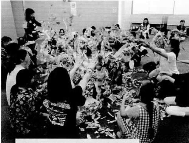
お家の中でこんなことしたらめまいがしそうですが…