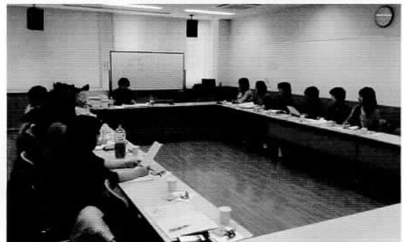
先生の具体的なお話に、熱心に耳を傾けます。