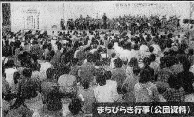
まちびらき行事(公園資料)

芸術性豊かな写真でなくてもかまいません。慣れ親しんだ景観、消えていった風景、ささやかなスナップ写真、また動植物など生きものの全般の写真をお寄せください。