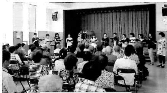
美しい歌声にうっとり♡

メインイベント、女声コーラス『コーロ・ルーチェ』の方々14名をお迎えし、～歌でいつまでも輝いていたい・歌で絆を深めたい～という思いとともに、美しい歌声で