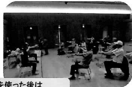
頭を使った後は シニアリーダー体操！