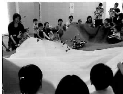
大きな布がフライパンに変身！ ポップコーンみたいに上手にボールがはねるかな？