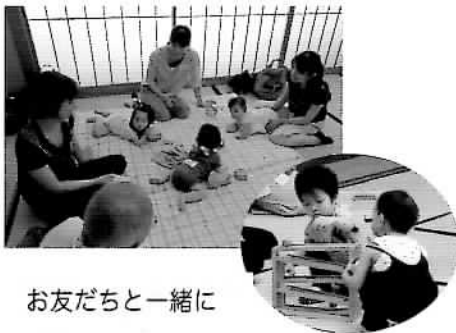
お友だちと一緒に

また、保健師さんと栄養士さんが来てくださり、相談に乗っていただいたり、わらべ歌を楽しんだりしました。