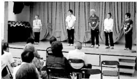
安彦さんとシニアリーダーの方々