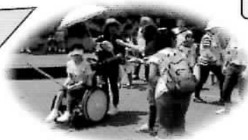
楽しいね スイカ割り(^o^)

夏の始まりを感じる流し そうめん・スイカ割り そして皆に会う機会を楽 しませて頂いてます。 (肢体不自由児 高2)