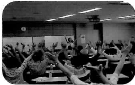
「天からいいもの降ってくる～」 両手を上にあげて腹式呼吸

参加者 59 名、スタッフ 17 名が先生の笑えるセリフで、顔の表情筋を楽しくストレッチ！