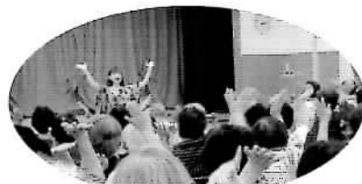
歌いながら、体も動かして