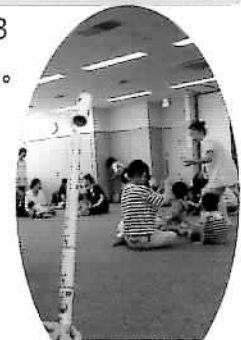
『ピュンピュンロケット』