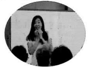
表情豊かな前川先生

講習会が終了するころには、全員の顔に『笑み』があふれ、幸せな気分 で帰路につきました。