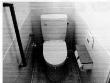
トイレのリフォーム例