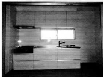
キッチンのリフォーム例