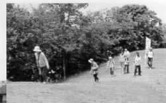
古墳の上を散策中