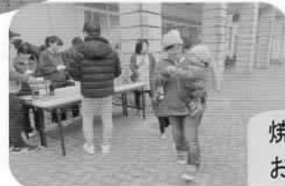
焼きマシュマロ おいしそうだね