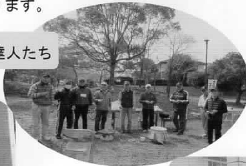
昔遊びの達人たち

4月2日（日）、さくらさくさくウォークラリーが今年も開催されました。桜のトンネルの下、たくさんの参加者が、スタンプカードを片手にポイントを回ります。