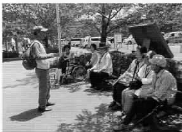
ひと休みして、ボランティアの詩吟を楽しみます