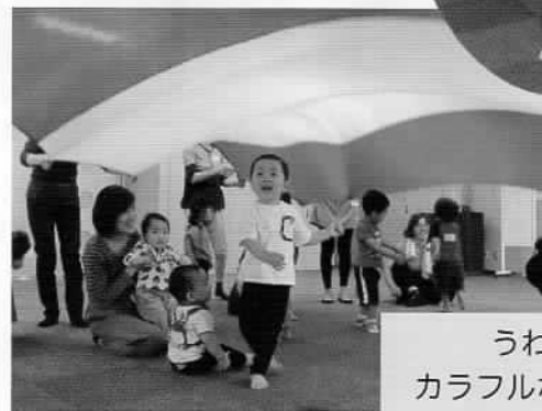
うわ～！カラフルなトンネル