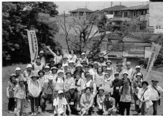
5kmコースのみなさん