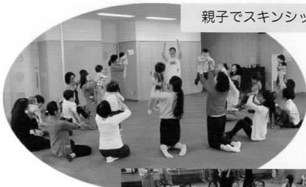
親子でスキンシップ