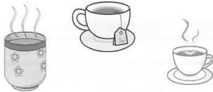
穏やかな雰囲気の中 会話が弾みます。