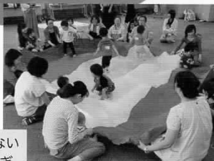
普段はなかなかできない大きな布で大はしやぎ