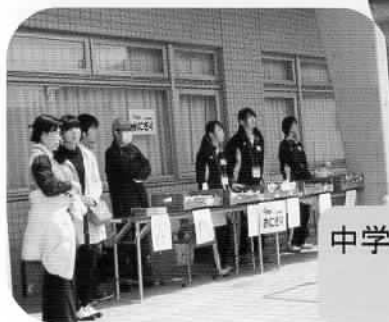
中学生ボランティアのみなさん