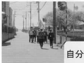
自分のペースで歩きます