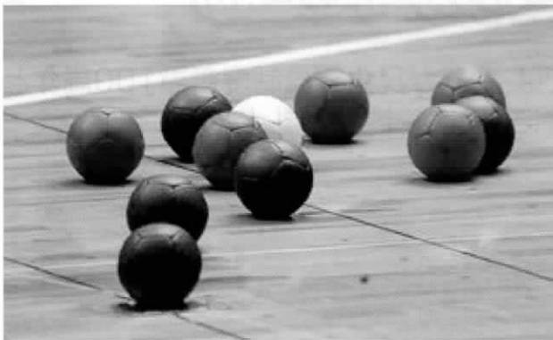
白い目標球(=ジャックボール)に赤・青のボールそれぞれ6球を投げたり転がしたりしていかに近づけるかを競います。