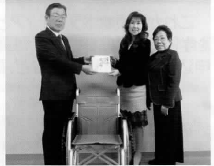
▲(株)美容ボランティアCHIBA様[右側2名]

大宮いきいきセンター設置募金箱 白井公民館設置募金箱 蘇我いきいきセンター設置募金箱 中央いきいきプラザ設置募金箱 都賀いきいきセンター設置募金箱 榑森公民館設置募金箱 土気いきいきセンター設置募金箱 轟公民館設置募金箱 平和公園管理事務所設置募金箱 星久喜公民館設置募金箱 緑いきいきプラザ設置募金箱 若葉いきいきプラザ設置募金箱 匿名