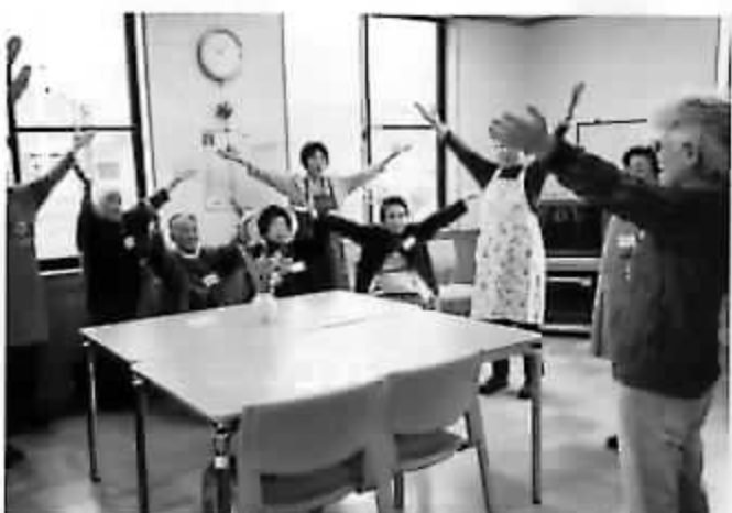
地域の高齢者に憩いの場を提供するなど、赤十字では地元に密着した活動も行っています。