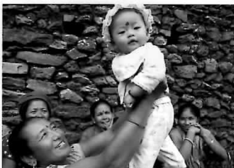
ネパール赤十字社支援事業

日本赤十字社が実施する国内の災害救護活動、 救急法などの講習普及事業、青少年赤十字活動、 国際救援活動など様々な活動は、国や県などの補助金によらず、赤十字の活動にご賛同いただいた皆様からの活動資金によって実施されています。