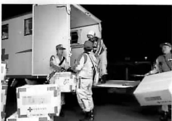
災害時に救援物資を迅速に届けられる体制をつくっています。