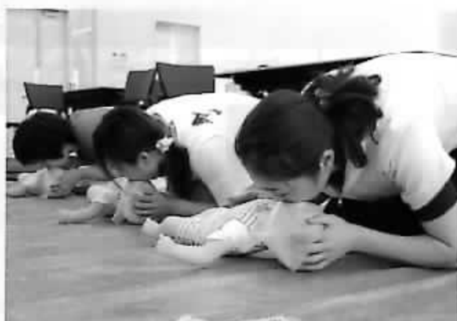
いのちを救う方法や、健康で安全に暮らす知識と技術を普及しています。