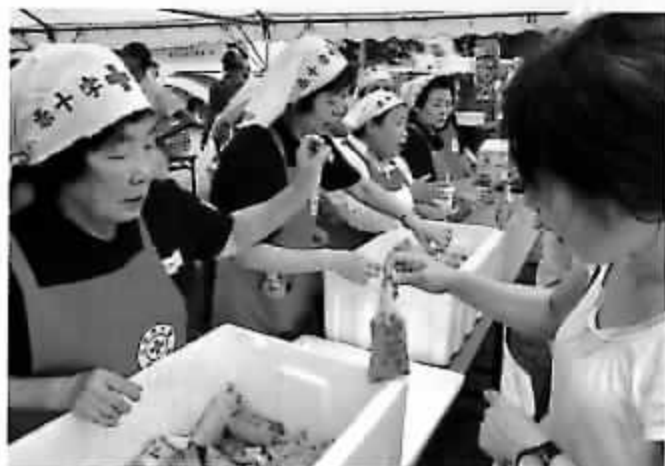
もしも災害が起きた時、被災者へ温かい食事を届けます。