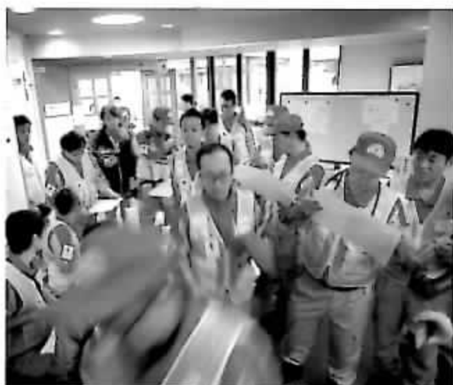
平成28年 熊本地震災害(全国から集まった救護班)

日本赤十字社は、常に社会のあらゆるシーンに目を向け、救いを必要とする人々のために人道的支援活動を展開しています。