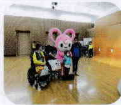
記念写真も撮ったよ