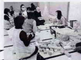
1歳以上のお子さんたち