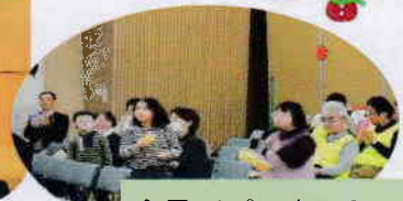
全員でパーカッション♪