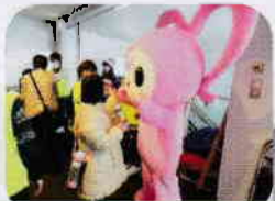
キャンディレイをかけて、 ハーティちゃんご挨拶

素敵なピアノの音色を楽しんだ後は、ピアノ伴奏で参加者全員のクリスマスソング大合唱です。ボランティアのみなさんも一緒に楽しめたクリスマス会でした。