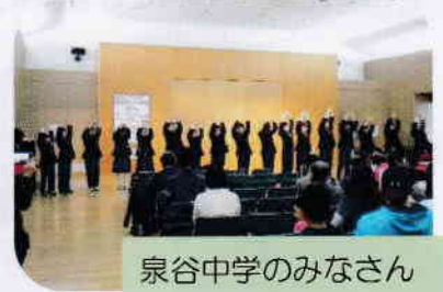
泉谷中学のみなさん