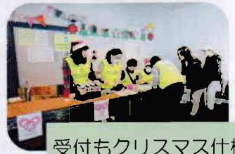
受付もクリスマス仕様

12月10日(土)、鎌取コミュニティセンター3階多目的ホールにて、冬のお楽しみ会が参加者92名で開催されました。フォーエヴァーのみなさんの落語とマジック、泉谷中学校特別支援学級の皆さんの発表と続きます。