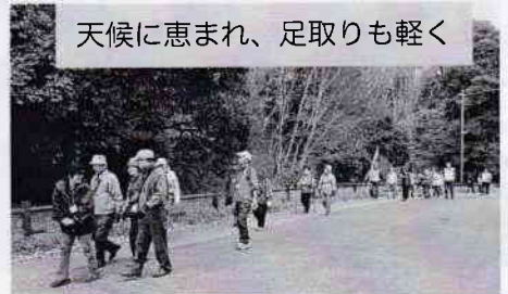
天候に恵まれ、足取りも軽く