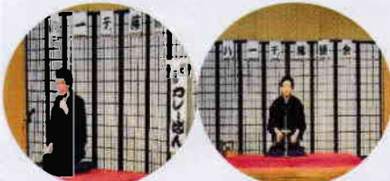
フォーエヴァーのみなさん