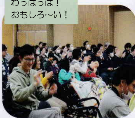
わっはっは! おもしろ〜い!