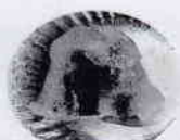
マッシュかぼちゃの焼き物