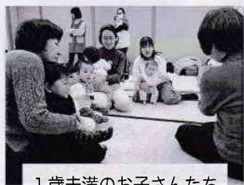
1歳未満のお子さんたち