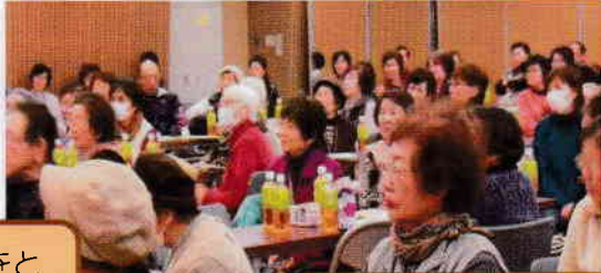
うのさくさんの好きなもの・・・握手・拍手・キャッシュ