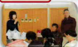
生活習慣病を予防しましょう