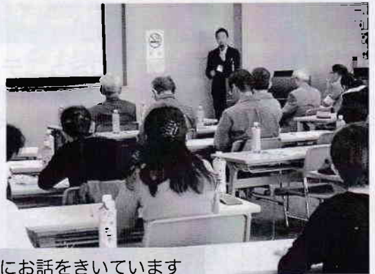
熱心にお話をきいています

また、多方面から来られたボランティアさんの活動がよりスムーズに行われるためにも、重要な拠点となります。