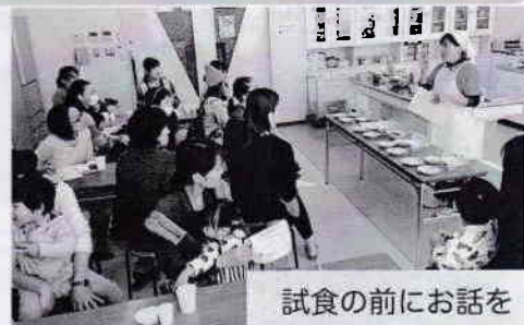
試食の前にお話を

11月17日、おゆみ野公民館にて開催され19組の親子が参加しました。今回はヘルスメイトさんによる、だしのとり方とおかゆの作り方・取り分け食と減塩について、1歳以上の子どものおやつについてのお話と試食がありました。