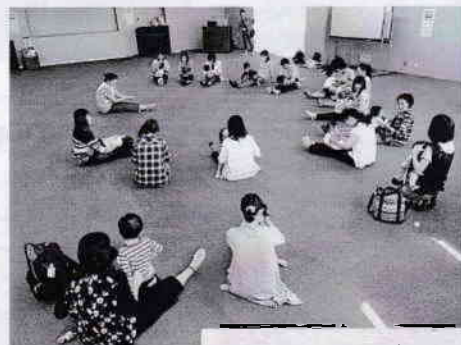
親子で一緒に動こう

親子19組が参加して、身体を動かしたり、ペットボトルを使ったガラガラを作ったりしました。