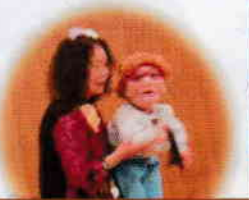
長生きの秘訣は?息をとめないこと (*^^)v