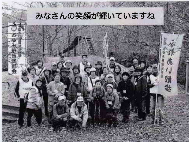
みなさんの笑顔が輝いていますね