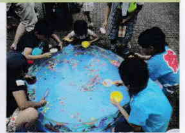
すくうぞ! お目当てのスーパーボール