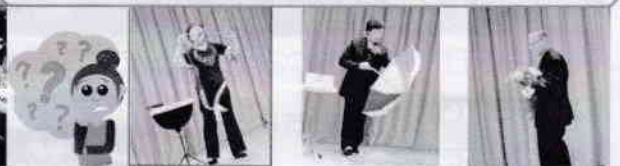
お見事なパフォーマンス！！