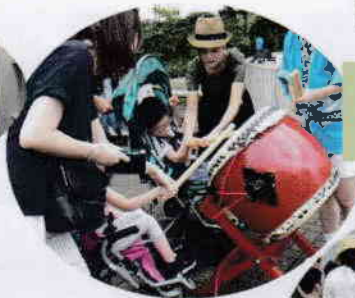
和太鼓の演奏だけでなく体験もありました