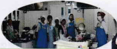
早くから、準備に取りかかります