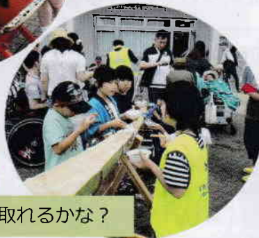
上手に取れるかな?