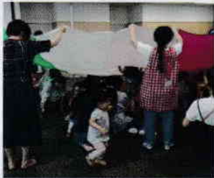
上がりま〜す、下がりま〜す