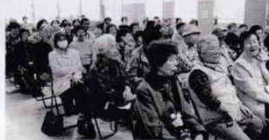
末広奇術会の皆さん&参加者の皆さん