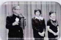
末広奇術会の皆さん

☆10月13日 おゆみ野公民館にて、末広奇術会の三人の皆さんによる“マジックショー”を楽しみました。