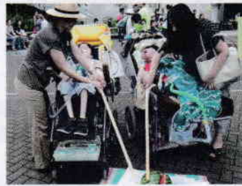
すいか割りに挑戦!!

お天気も上々、『そうめん流し』にもってこいでした。参加された皆さんの素敵な笑顔が見られ、ボランティアメンバーも一緒になって楽しむことができました。