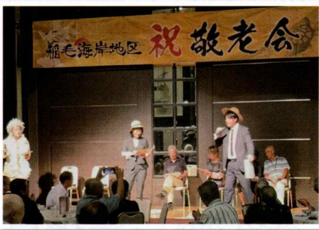
▲ 参加者参加型の余興で大盛り上がり! 麦畑〜♪

コロナ禍により令和2年から開催を見送っていた敬老会。たかが3年間実施しなただけで、地域の希薄化は大きく広がってしまいました。それを解消すべく、中学校の体育館からホテルの宴会場に会場を刷新して、きらびやかな会になるように取り組んでいます。