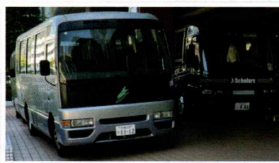
◀ 地域と会場をつなぐ送迎バス

地区部会としてもフレイル予防を鑑みた活動を目指し、地域の皆さんが少しでも外出しやすい形に、そして、皆さんとの交流も深めてもらいたいと思っています。そうしたことを具現化させるために会場まで4台の送迎バスを手配し、民生委員や福祉活動推進員がサポートしてスムーズに移動ができています。