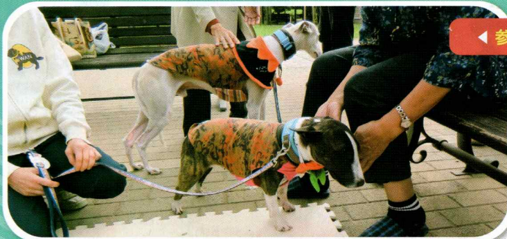
◀ 参加者の皆さんを癒してくれるワンちゃんたち