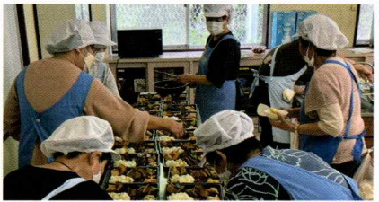
▲気持ちを込めて、参加者の皆様へ

毎月第3水曜日にふれあい食事会を開催しています。厨房では、作るメニュー毎に担当が4か所に分かれ調理を進めます。食材の中には、家庭で採れた野菜も。参加者が食べやすいように、鮭の皮を強めに焼いたり、すだちの種を取り除いたり、細やかな気配りを感じます。大量の調理をするには、臨機応変な対応が必要となることもあります。食事を通じて参加者の笑顔につながればと、一致団結します。