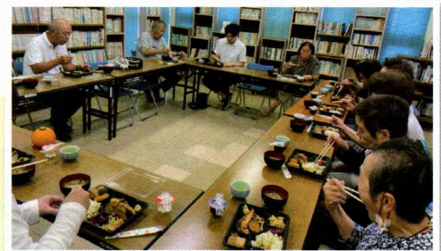
▲思い出話に花を咲かせながらいただきます

食事会では「おいしい！」という声とともに笑顔があふれます。この日は、食後に「心象風景」と題して思い出を語りあった後、近隣の高齢者福祉施設の理学療法士さんによる頭も使った運動、最後には懐かしい歌をうたい楽しい時間を過ごしました。