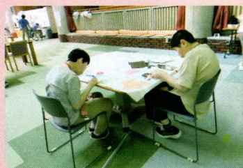
▲ちぎり絵作業に熱が入り楽しそうに取り組んでいます。

法人としてこれからも地域と共に、参加できる活動を続けていきたいと考えているそうです。