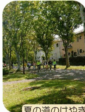
夏の道のけやきはちょうど良い 日陰を作ります