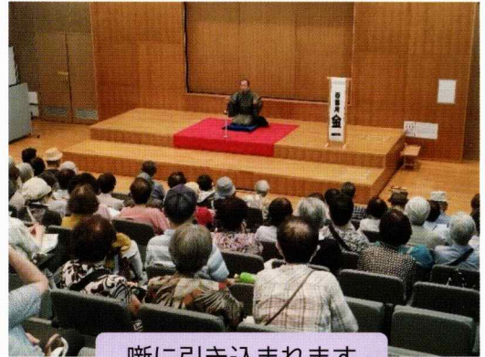
噺に引き込まれます

今回の演目は「湯屋番」と「赤とんぼ」。落語は耳と目で情景を思い浮かべ、その世界へ入っていき、オチは意外な結末になったりするのが面白いところ。クスッと笑えるオチに、盛り上がりました。