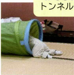
おそろおそろトンネルの中に

月齢の違いはあっても、お子さんを挟んでスタッフも一緒に、話がはずみます。おそらくお子さん同士も、いろいろな刺激をもらっていることでしょう。