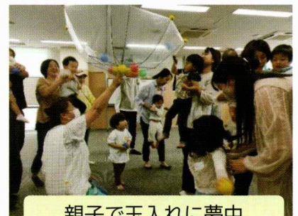
親子で玉入れに夢中