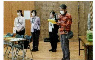
健康課のみなさんと三丸委員長