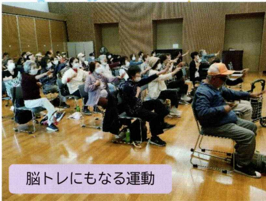
脳トレにもなる運動