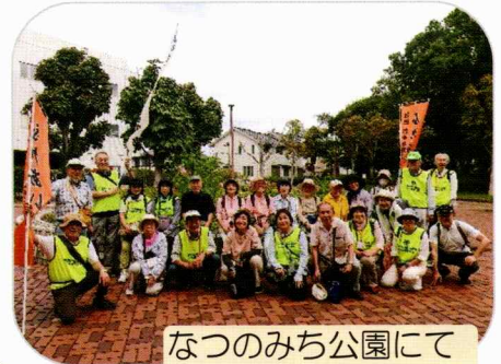
なつのみち公園にて

9月26日(木)鎌取コミュニティセンターより参加者20名 スタッフ14名が「なつのみち公園」を目指して元気に出発しま した。今回はボランティア委員会の皆さんが暑さを考慮して距離 は少し短くなり、途中は水分補給と休憩もしっかり取りました。 前回雨のため中止になった「ふれあい散歩」でしたので、皆さん と顔を合わせるのは久しぶりです。そのため 会話もいっそう弾み楽しく歩くことが出来ま した。