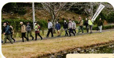
大百池公園を歩く皆さん