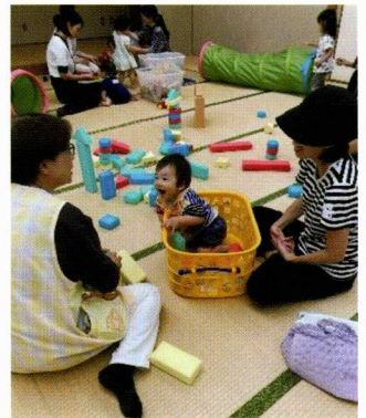
つみきのケースも乗り物に