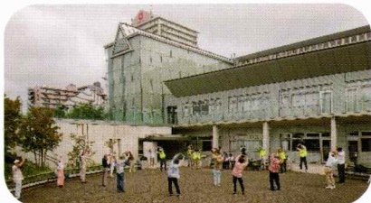
しっかりと準備体操をします