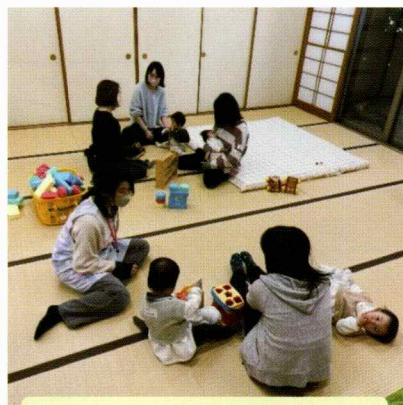
親子でくつろぎながら