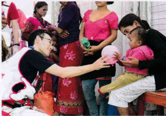
国外の災害でも迅速に支援を行います(平成27年ネパール地震)