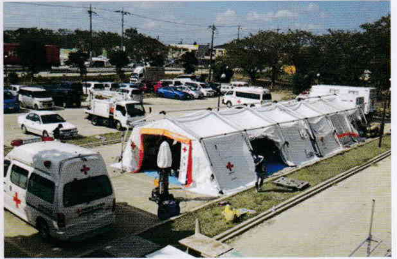
平成27年 台風第18号等大雨災害

日本赤十字社が実施する国内の災害救護活動、救急法などの講習普及事業、青少年赤十字活動、国際救援活動など様々な活動は、国や県などの補助金によらず、赤十字の活動にご賛同いただいた皆様からの社費や寄付金によって実施されています。