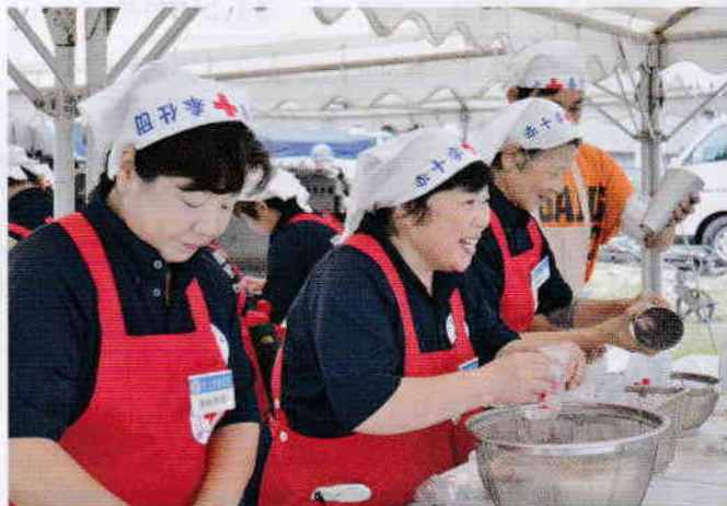
被災者にあたやかな食事を届けます(九都県市防災訓練)