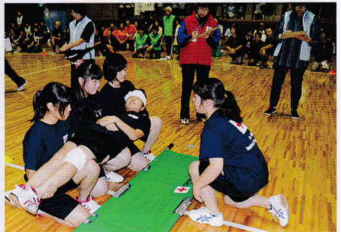
友達を助ける技術を学びます(救急法フェスタ)