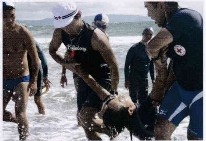
いのちと健康を守る知識を伝えます(水上安全法)