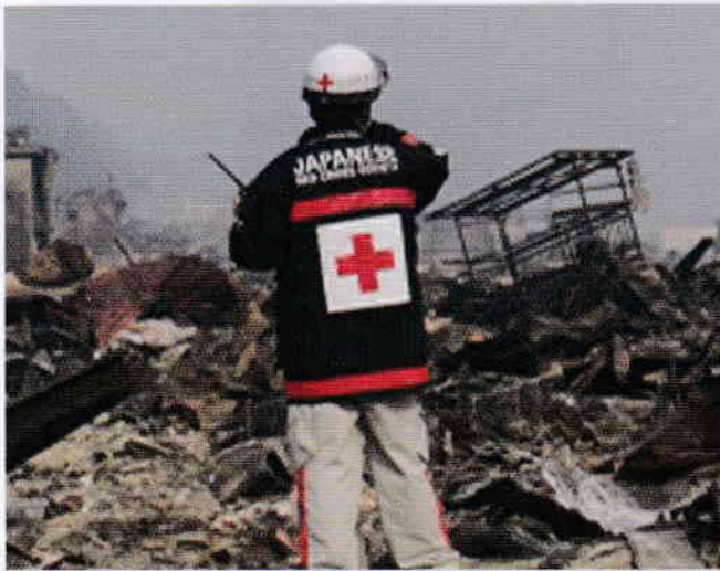
平成23年 東日本大震災

日本赤十字社は、常に社会のあらゆるシーンに目を向け、救いを必要とする人々のために人道的支援活動を展開しています。