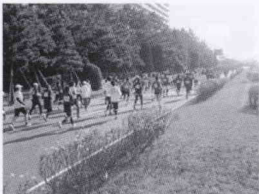
マラソン大会コース整理員