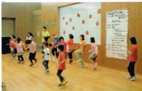
スリーセブンのみなさんによるダンス