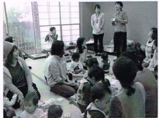
保健師さんのお話 いつも、勉強になります

1月19日、鎌取コミュニティセンターにて開催されました。 今回は21組ほどの親子が参加しました。