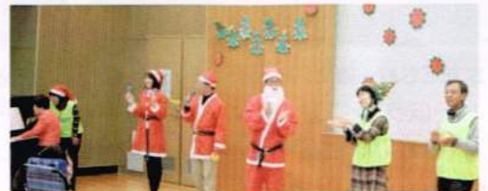
サンタの衣装で、委員のみなさんも盛り上げます