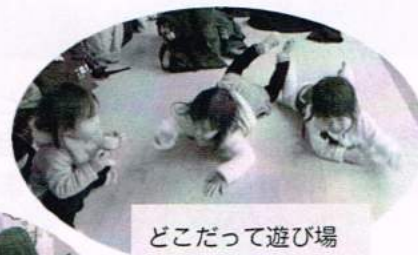
どこだって遊び場