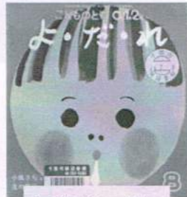
子どもと一緒に 絵本で学ぼう