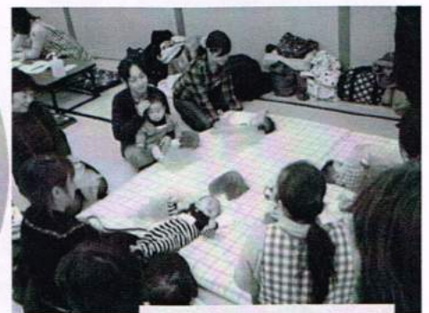
歌遊びをしながら 親子のふれ合い TIME