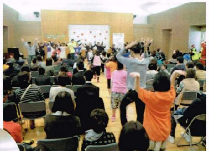
会場のみなさんと一緒に『妖怪体操』

その後は、『おかいものけん』を使ってのゲームやお買い物を楽しみました。長袖を着ていると、汗ばむほどの熱気でした。