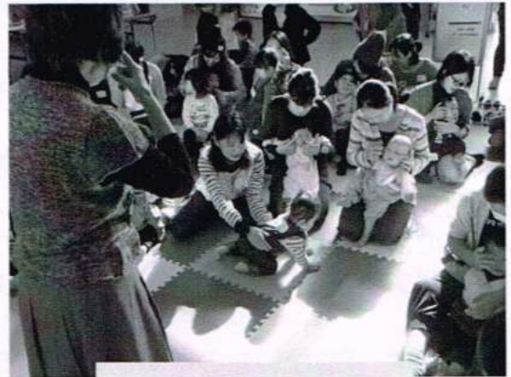
日だまりの中で ♪あ〜がり目、さ〜がり目♪

今回、いつものように2部屋確保ができず、和室とロビーを使っでの開催でしたが、自然光の中違和感なく、子どもたちも楽しんでいました。