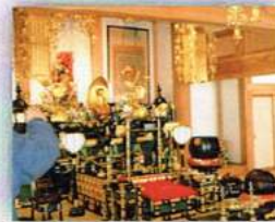
お地藏さまもお出迎え