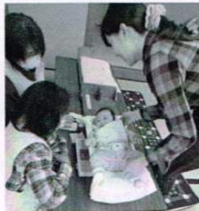
大きくなったかな？ 立って測る測定器もあるよ。