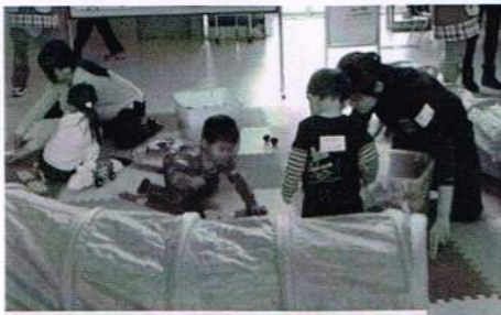
お友だちも一緒に、あ〜そ〜ぼ！