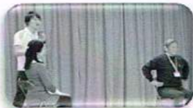
安彦さんとシニアリーダーの皆さん