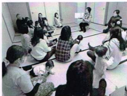
親子で絵本の世界へ