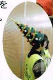
大村委員長はツリーの帽子