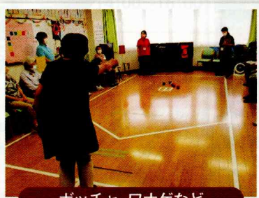
ポッチャ・ワナゲなど