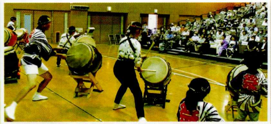
▲長寿を祝い交流を深めます

区域内で開催される敬老祝賀会へ協力しています。そのうちのひとつ、千葉寺青葉町自治会では和太鼓、フラダンス、社交ダンス、大正琴など演者は地元の方々です。加えて町内自治会、民生委員など住民同士が連携、協力し、温かくにぎやかな会が催されています。