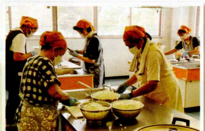
▲調理場では連携プレーが光ります

「あと10分で炒めまーす！」 抜群のチームワークで、100人以上のカレーを作っていきます。今日はキーマカレー。なすとコーン入りです。チキンカレーやドライカレーなど、毎回色々なカレーを作ります。