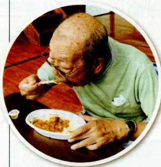
▲部長もいただきます!