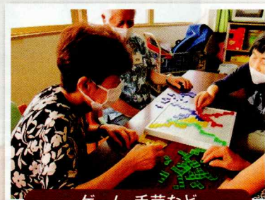
ゲーム・手芸など