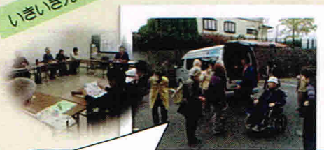
いきいき元気敷こやつ

10/26 脳トレや歌、介護予防に関するお話や体操 を行っています。この日は「介護タクシー」 について、見学・実車体験をしました。