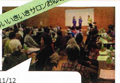
ふれあいいきいきサロンおゆみ野

10/26 脳トレや歌、介護予防に関するお話や体操 を行っています。この日は「介護タクシー」 について、見学・実車体験をしました。