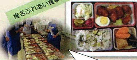
椎名ふれあい食卓

11/1 約300名の方が当ブースに 来ていただきました。 足指力の測定もやりましたよ。