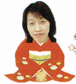
本年もよろしくお願い申し上げます。