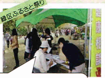
緑区ふるさと祭り

11/1 約300名の方が当ブースに 来ていただきました。 足指力の測定もやりましたよ。