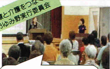
医療と介護をつなぐ会 おゆみ野実行委員会

10/10 在宅医療と介護の講演や見て 聞いて学ぶ体験型のイベントが 行われました。他に、緑わくわく 体操の紹介もありました。