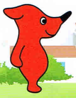
千葉県マスコットキャラクター「チーバくん」