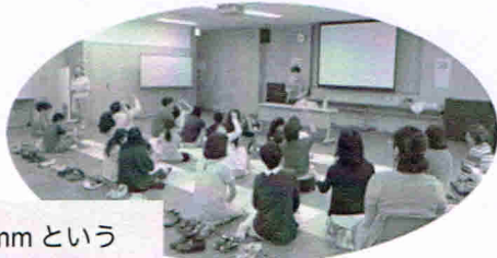
0.1mmという 受精卵の 大きさを実感

「いのちとは、身体全て」「自分を大事にするためには、周りの人を大事にすること、「ありがとう」「ごめんなさい」を言おう」等のお話や、妊婦さんの疑似体験もありました。