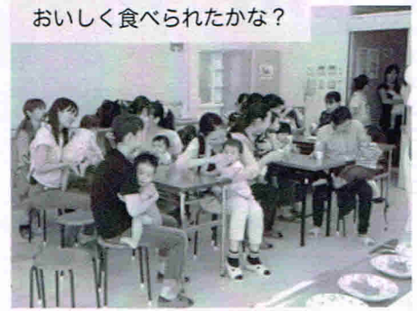
おいしく食べられたかな？