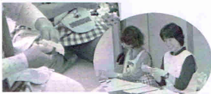
開催前、おもちゃをひとつずつ除菌したり、受付の資料用意をしたりとスタッフの方々は準備に余念がありません。

9月15日、鎌取コミュニティセンターにて開催されました。31組の親子さんが参加しました。