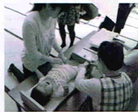
大きくなったかな？ ちょっと我慢してね。