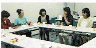
第1回 参加者の皆さん

今年度第1回 6月17日 参加者は7名・スタッフ6名、今回の話題は進級後の生活の変化や近況報告、成年後見人制度に関する話などでした。