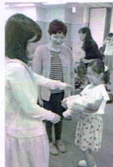
あみ先生が見守る中 赤ちゃんの重さや 柔らかさを体感