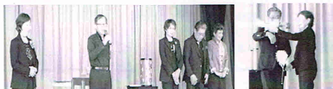
*“末広奇術会”の皆さん *不思議ハトが！

千葉市緑保健福祉センターでは、健康についてのいろいろな相談(栄養・歯科・健康など)を行っています。ご利用ください。