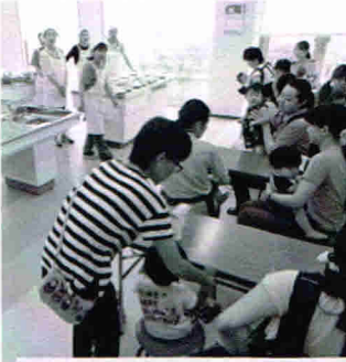
ヘルスメイトさんのお話 お子さんも一緒に

今回は、『夏のおやつ』を中心に、乳幼児期の食事について、ヘルスメイトさんのお話や試食会も行いました。