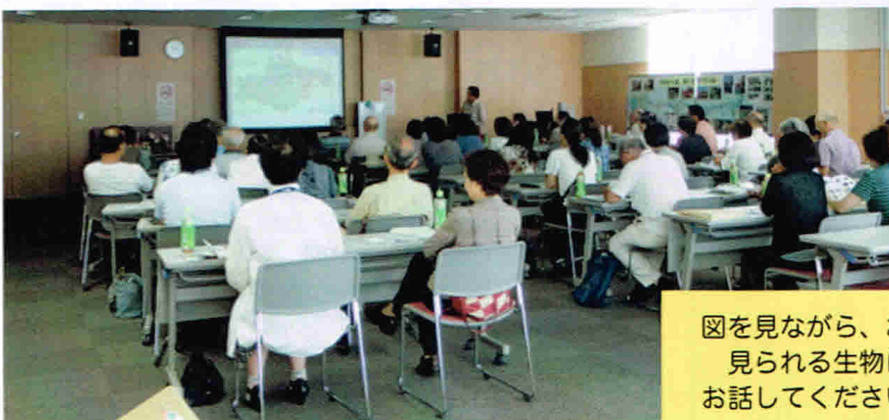
図を見ながら、おゆみ野で見られる生物についてお話していただきました。

1部「おゆみの道の生物」では、おゆみ野に見られる生物の種類やその過去・現在、そして人と生物の共生を目指しての今後の課題について、2部では、活動紹介がありました。