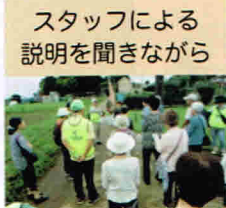
スタッフによる説明を聞きながら