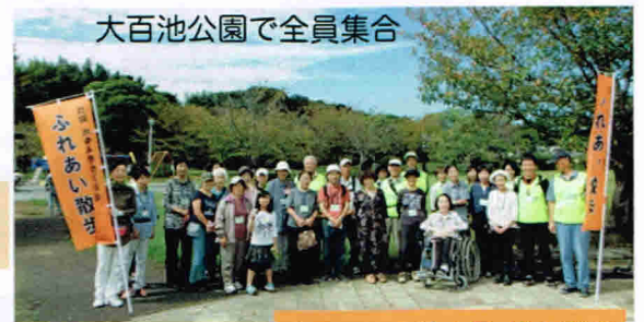
大百池公園で全員集合

今回は、おゆみ野公民館を出発して、およそ2.5キロの道程を、おゆみ野の歴史にふれながらの散歩となりました。