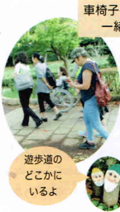
車椅子の方も一緒に