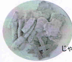
グミ チキンナゲット じゃがいもスティック 小魚せんべい