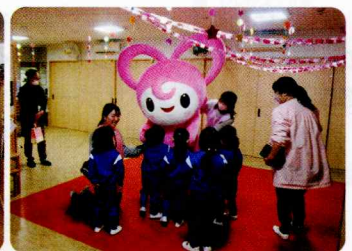
第2幕張海浜保育園の園児のみなさんより献金(寄附)をいただきました。やさしい気持ちをありがとうございました。