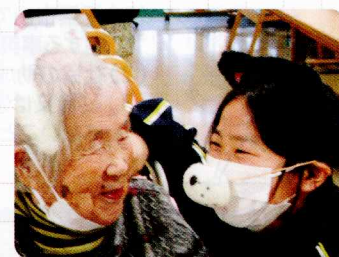
ご利用者に寄り添い