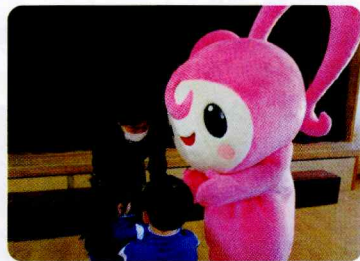
幕張海浜こども園・幕張海浜キッズの園児のみなさんから献金(寄附)をいただきました！

美浜区にある社会福祉法人 愛の園福祉会が運営する、幕張海浜こども園・第2幕張海浜保育園・幕張海浜キッズ(放課後児童クラブ)では、法人の基本理念である、「もっとも小さな者のひとりに仕える」という基本理念に立ち、一人ひとりが愛され、大切にされていることを感じながら、世の中で困っている人たちが弱い立場の人たち、体の不自由な人たちに対して手を差し伸べられるような思いやりの気持ちを育ませたいという考えから、毎年、クリスマスの季節に合わせてアドヴェント献金(募金活動)を行っております。『自分たちも小さなサンタクロースになれるように』と、プレゼントをもらうだけでなく、分け与えるという気持ちを持ち、保護者の方たちからの理解も得ながら、それぞれの子どもたちがおうちでできるお手伝い等を行うなどして、そのお小遣い分を献金(寄附)するという、助け合いの気持ちで、毎年、本会へもご寄附をいただいております。