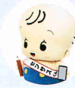
国勢調査 イメージキャラクター センサスくん