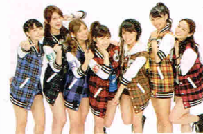
公式応援団 アップアップガールズ(仮)