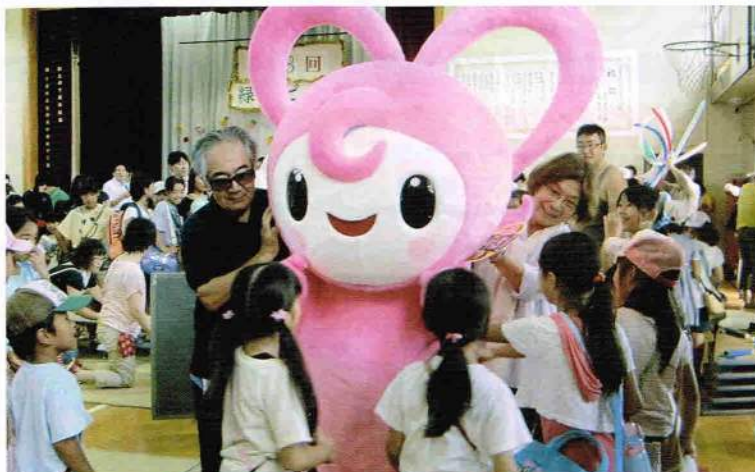
《さまざまな世代が楽しめるイベント》

稲毛区緑が丘地区では、10年前から「緑ンピック」が実施されています。緑ンピックは、青少年育成委員会の主催のもと、「学校と家庭と地域の連携の輪をひろげよう」をテーマに地区部会をはじめ地域内の16の活動団体が協力・参加し、開催される当地区内の大きなイベントになっています。