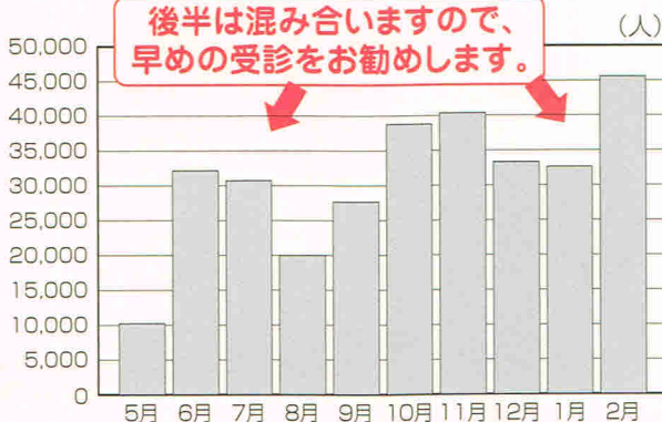
平成25年度の月別受診者数