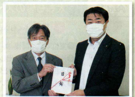
第一生命労働組合幕張支部様[右]