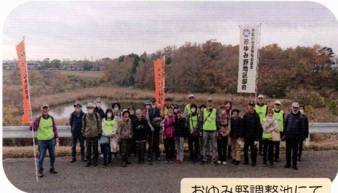
おゆみ野調整池にて

11月28日(月)鎌取コミュニティセンターより、おゆみ野の秋を訪ねておゆみ野調整池と泉谷公園へ参加者20名とスタッフ15名で歩きました。