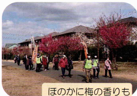
ほのかに梅の香りも

前回と違ってすっかり冬景色となった泉谷公園で最後の休憩をして5km弱の道のりを元気に歩きました。