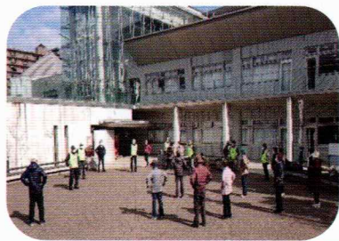
歩く前に身体をほぐして

2月20日(月)鎌取コミュニティセンターより、冬の日差しの中を参加者20名スタッフ14名で歩きました。今回は冬の道の花である梅を目指しました。おしゃべりに花が咲いた参加者の皆さんの列