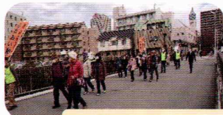
おしゃべりも楽しい

は時には長くなってしまいますが、ボランティア委員会のメンバーが前と後ろにつき添いました。