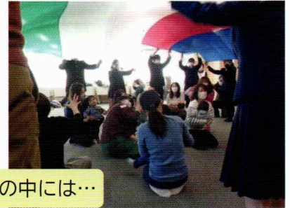
大きな布の中には…