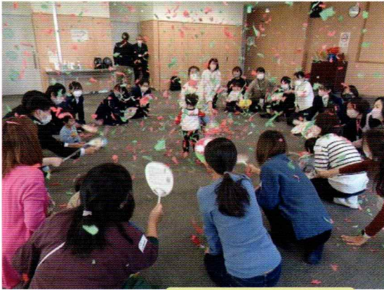
うちわで舞う紙吹雪

12月14日（水）緑保健福祉センターにて開催され、親子9組、スタッフ5名と保健師2名、聾学校の生徒さん10名が参加しました。大きな布を使った遊びは圧巻で、巻き起こる風にお母さんも子どもも大喜び！ちぎった紙をうちわで吹き合う遊びも皆大興奮。その後、「お片付け」という名の「クリスマスリース」作り。一緒に参加した生徒さんも、素敵な自分だけのリースを完成させ、楽しさ倍増だったようです。