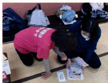
ヘルスマイトさんが丁寧に説明