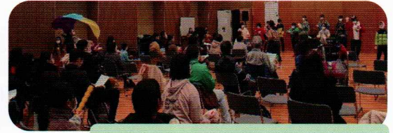
全員でクリスマスソングを♪