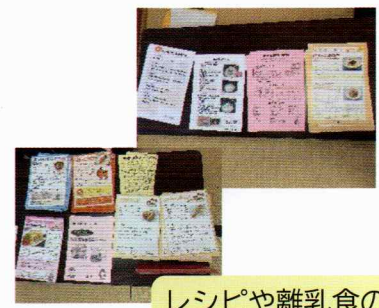
レシピや離乳食の進め方の資料