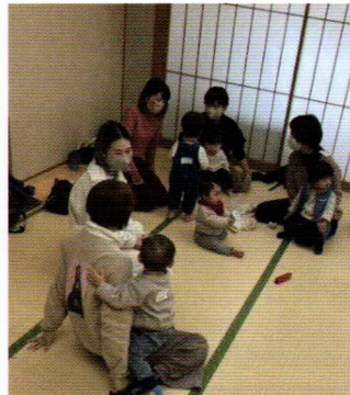
お母さん同士、お話も弾みます

また、お父さんのパワフルな遊び方に、お子さんは大興奮して、他のお子さんも興味津々でした。