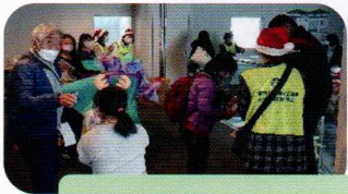
お見送りのスタッフ