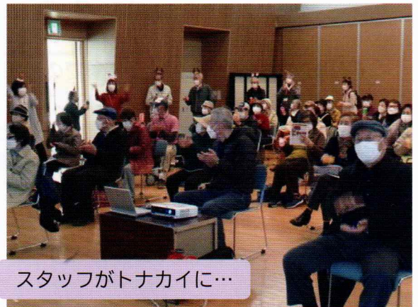
スタッフがトナカイに...

後半、クリスマスソングでトナカイに扮したスタッフたちが会場を回り、大いに盛り上がりました。最後に、サンタクロースから嬉しいプレゼントが用意されていました!