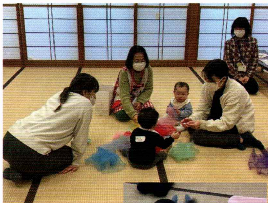
月齢の近いお子さん同士で遊びもわくわく