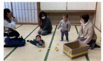
いろいろな人と関わって