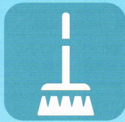
プログラム 終了後清掃