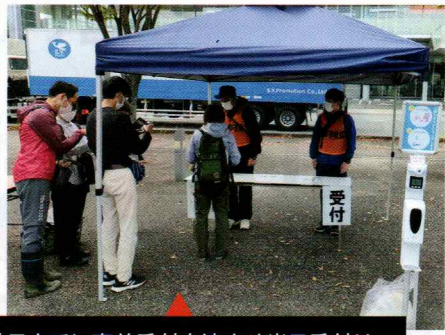
前日までに事前受付を済ませ当日受付はQRコードをスマホで「ピッ」と読み取り氏名等を登録

台風15号の豪雨により、静岡県内の市町村が広範囲に多数の人的・物的な被害を受けたため、『関東甲信越静岡ブロック都県指定都市社会福祉協議会(1都10県8市)災害時の相互支援に関する協定』による静岡県社協からの要請に基づき本会から職員を派遣しました。