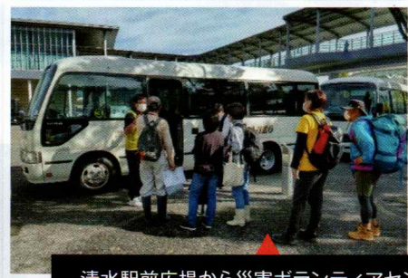
清水駅前広場から災害ボランティアセンターまでバスで送迎