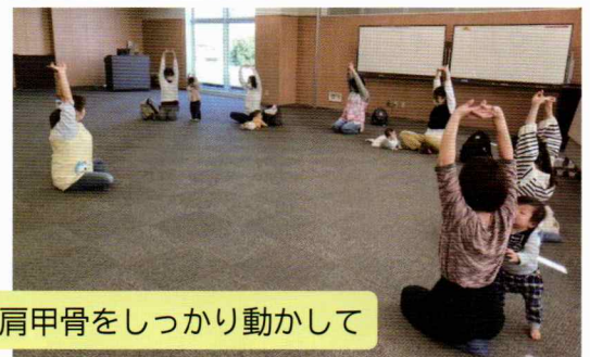
肩甲骨をしっかり動かして