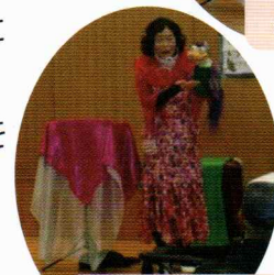
ジョージ君も元気です