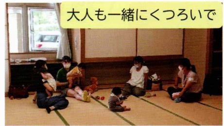
大人も一緒にくつろいで