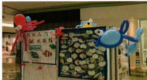
8月31日(水)まで展示されました

7月9日(土)から鎌取コミュニティセンターに展示されていた『おゆみ野水族館』が8月16日(火)イオンおゆみ野けやき街に移動しました。当日、『おゆみ野水族館』は障がい者福祉委員会のメンバーが破損の無いよう慎重に運搬しました。