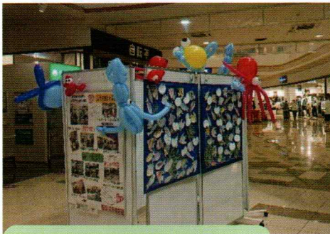
社協おゆみ野地区部会の活動パネルも

7月9日(土)から鎌取コミュニティセンターに展示されていた『おゆみ野水族館』が8月16日(火)イオンおゆみ野けやき街に移動しました。当日、『おゆみ野水族館』は障がい者福祉委員会のメンバーが破損の無いよう慎重に運搬しました。