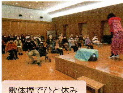
歌体操でひと休み

11月10日(木)鎌取コミュニティセンターで参加者41名スタッフ12名で開催されました。