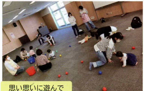
思い思いに遊んで

月齢の小さなお子さんが多く、子どものお世話や抱っこなど、どうしても肩が前に出ていき肩周りが凝っているお母さんが多いということで、まずはお母さんたちの身体ほぐしから始まりました。子どもが成長すると嬉しいけれど、大変さも増してくるので、セルフケアも大切にしましょうというお話がありました。