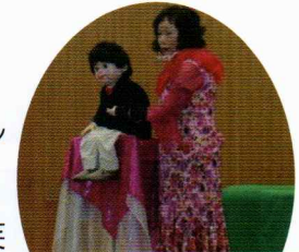
二十歳になった ふくちゃん