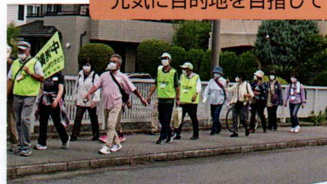
元気に目的地を目指して