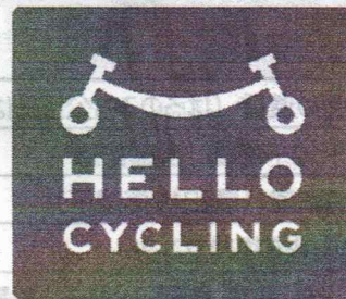
(おゆみ野地区のステーション)