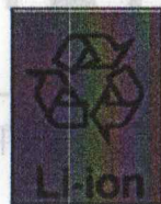
リチウム イオン電池