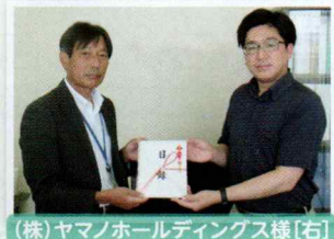
(株)ヤマノホールディングス様[右]