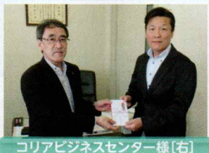
コリアビジネスセンター様[右]