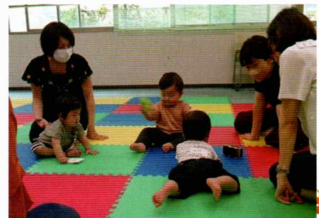
子どもが笑顔だと周りも笑顔

スタッフがやさしく見守る中、安心して遊ぶ子どもたちのうしろには、お母さんのマスク越しの笑顔がありました。