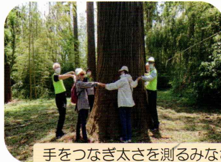
手をつなぎ太さを測るみなさん