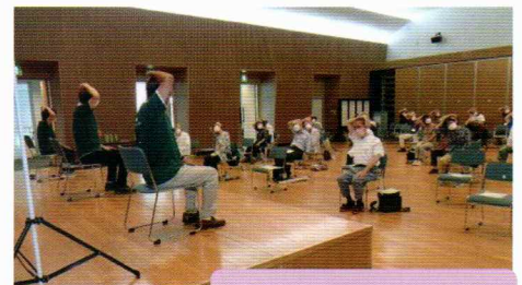
椅子に座って、体操