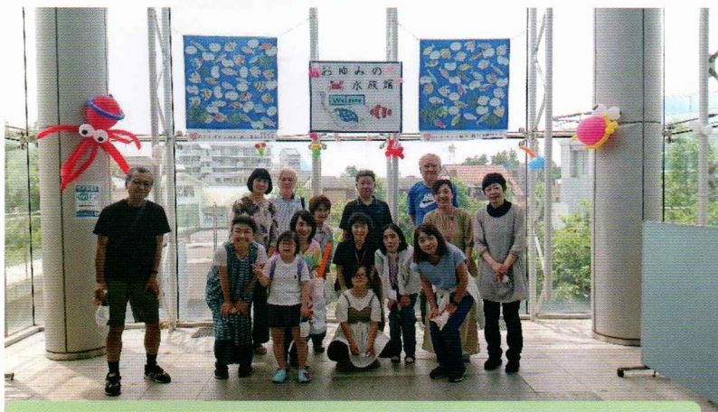
お疲れさまでした、ステキな水族館が出来上がりました