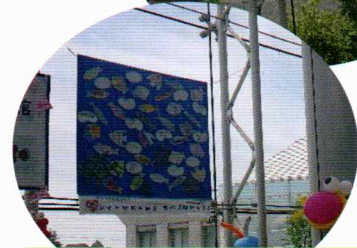
2階のロビーに展示しました