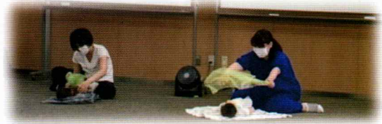
マスクありでも、目を合わせれば