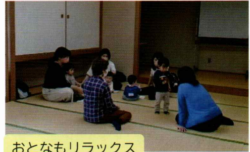
おとなもリラックス

以前のように、こちらでおもちゃを用意したり身体測定などできませんが、お手持ちのおもちゃで遊んだり、受付の鉛筆でお絵かきしたりしました。お母さん同士も、和やかにおしゃべりしたり、情報交換したりしていました。