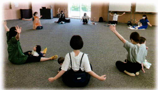
身体も心もほぐして