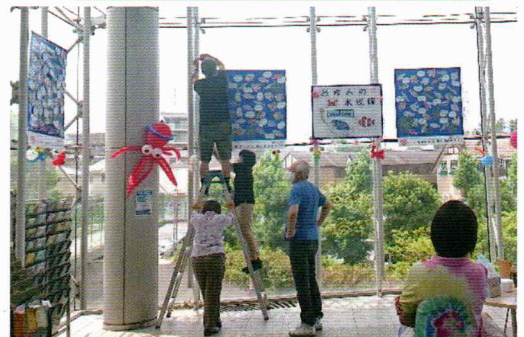
展示期間は8月16日(火)迄でした