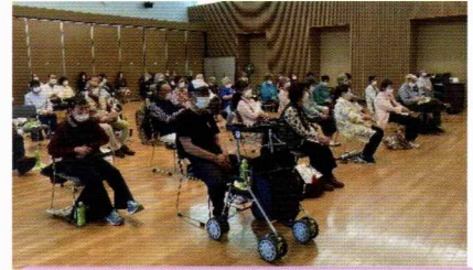
落語に耳を傾けるみなさん