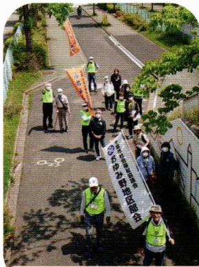
みんなでのんびり季節を感じながら