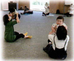
お友だちと一緒に ママと一緒に