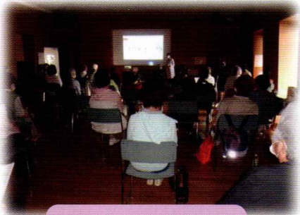
熱心にスライドを 見ているみなさん

6月9日(木)、鎌取コミュニティセンターにて、ふれあい・いきいきサロンが開催されました。参加者44名、スタッフ18名が参加しました。