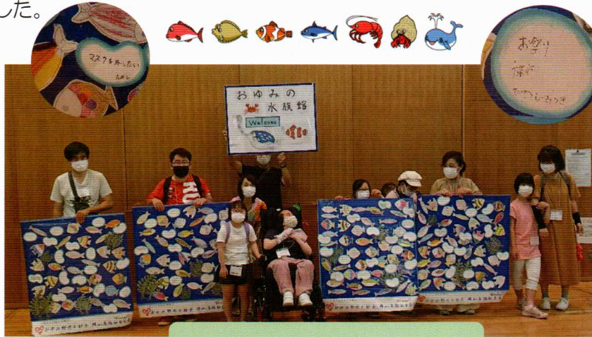
たくさんの魚が泳いでいます

7月9日(土)、鎌取コミュニティセンターで参加者11名と障がい者福祉委員会のメンバー他14名でおゆみ野水族館を作りました。毎年お楽しみ会に参加している皆さんが書いた水泡のメッセージカードと魚のイラスト(58名分)を4枚の水槽に貼っていきます。あっという間に4枚の水槽がいっぱいになりました。