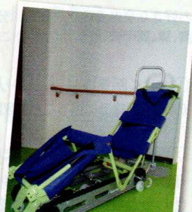
(株)サンワ様より 和陽園へ非常用階段避難車を 寄贈いただきました