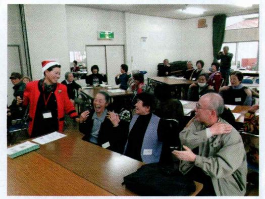
▲にぎやかな「ふれあい・いきいきサロン」の様子

平時からの三者連携やボランティア養成に取り組み、発災時には速やかに災害ボランティアセンターを設置・運営できるようにします。