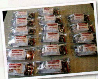
日産緑化(株)千葉支店様より 視覚障害体験グラス及び妊婦擬似体験教材を いただきました