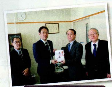
(株)千葉経済開発公社様[右]