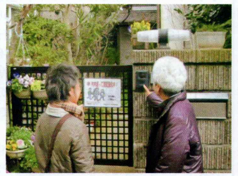
▲訪問による見守り活動