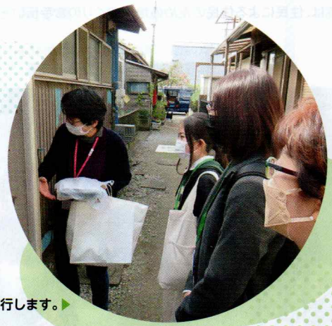
配食には学生さんも同行します。▶

当該地区部会では、地区部会設立の翌年にあたる昭和62年11月より、主に70才以上の独居の方に対し、栄養の確保、食生活全体への注意喚起、見守りや安否確認などを目的として、月1回、ボランティアが南部青少年センターで調理した手作り弁当の配食を開始。今年で35年目を迎えました。