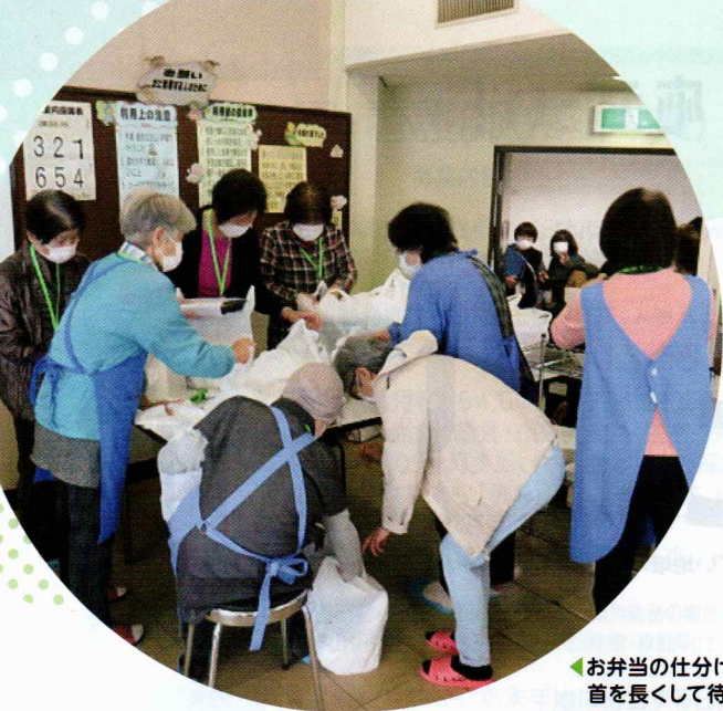
◀お弁当の仕分け完了! 首を長くして待つ!? 高齢者のもとへ