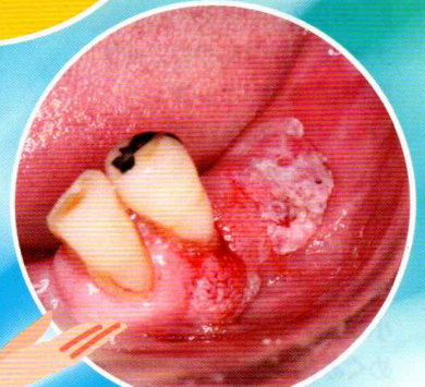
78歳 男性 歯肉がん手術を受け、 経過良好