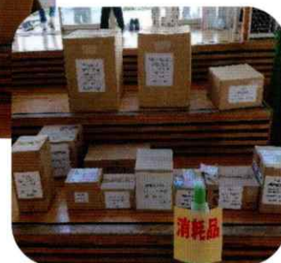
5セットのマンホールトイレがあります

次回の定例会は千葉市防災対策課による「感染症対策を踏まえた防災対策について」の講座を受講後、避難所開設訓練の問題点や反省点を話し合う予定です。