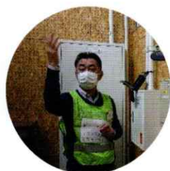
委員長がキーボックスの説明

委員が避難者と同様に避難者カードの記入をした後、委員長より本日の訓練の説明があり、避難所の鍵の場所と開錠方法を確認しました。